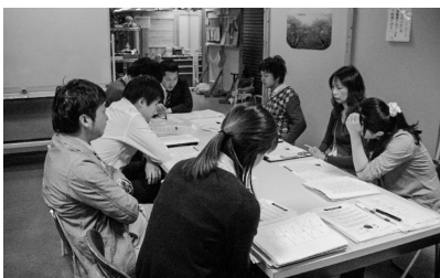
チームミーティング

アウトリーチには、覚悟と責任感という強い意志、そして粘り強さや辛抱強さだけでなく限りなく忍耐を必要とする支援でもあるということをよく理解できました。『常に伴奏型支援』を前提としたアウトリーチのあり方についての熱き思いと、当時者の「SOS」に耳を傾け、応えるための繊細な活動、取り組む姿勢について学ばせていただきました。ありがとうございました。（取材／紫園 来未）