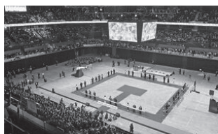
SAGAアリーナのグランドオープンを祝い、4方向を向いて38人で行ったテープカット

佐賀県が佐賀市日の出に整備したSAGAアリーナが13日、オープンした。県民約45,000人が記念式典に参加し、「新時代のエンターテインメント空間」の誕生を共に祝った。従来の体育施設と異なり、スポーツだけでなく、コンサートや展示会など多様な活用が見込まれている。山口祥義知事は「日本屈指のアリーナ、世界基準のアリーナになった。多くの感動がここから生まれる」と期待を込めた。アリーナは、SAGAアクア(プール)やSAGASTADIUM(陸上競技場)で構成するSAGASPORTSパークの中核施設。2024年の国民スポーツ大会・全国障害者スポーツ大会のメイン会場として、16年から始まったパークの整備は、アリーナの完成により終了した。パーク全体の整備費は540億円で、このうちアリーナに257億円を要した。