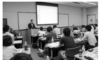
アウトリーチ養成研修会