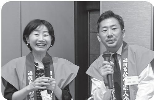
司会の2人（木原理事・新富理事）