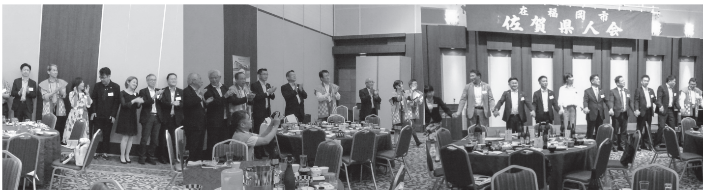
最後はやはり、「栄の国」の総踊りです。