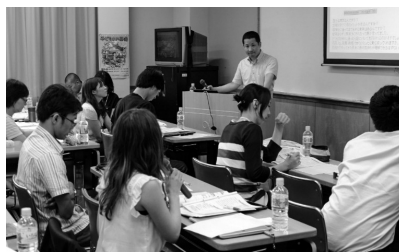
アウトリーチ養成研修会