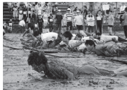
潟スキーに乗ってスピードを競うガタリンピック名物の「人門ムツゴロウ」

◆2023年2月3日 有明海の干潟を舞台にした運動会「第39回鹿島ガタリンピック」が4日、鹿島市音成の道の駅鹿島（市七浦海浜スポーツ公園）で開かれる。国内外から約1400人が参加し、「ガタチャリ」などユニークな8競技を泥まみれになって楽しむ。観覧無料。 新型コロナウイルス感染拡大の影響で中止が続き、4年ぶりの開催となる。日本一の干潟差を誇る有明海の干潟を生かした「まちおこし」として1985年に始まり、民間団体やボランティアが支え、きた鹿島市の名物イベント。今回は「リスタート（再始動）」をテーマに開催する。 競技は午後1時から同3時40分までで、地元の小学生対抗レースのほか、ロープにぶら下がって干潟に飛び込む「ガタザン」、自転車で行く干潟の板を走る「ガタチャリ」、干潟を走るタイムレース「25メートル自由ガタ」などが行われる。 実行委員会は「笑いあり、真剣勝負ありの競技を楽しんでほしい」としている。会場には観覧者用の駐車場がないため、実行委は公共交通（JR長崎線肥前七浦駅から会場まで徒歩5分）が、同市古枝の祐徳稲荷神社駐車場から運行される無料シャトルバスを利用するよう呼びかけている。 ◆2023年6月1日